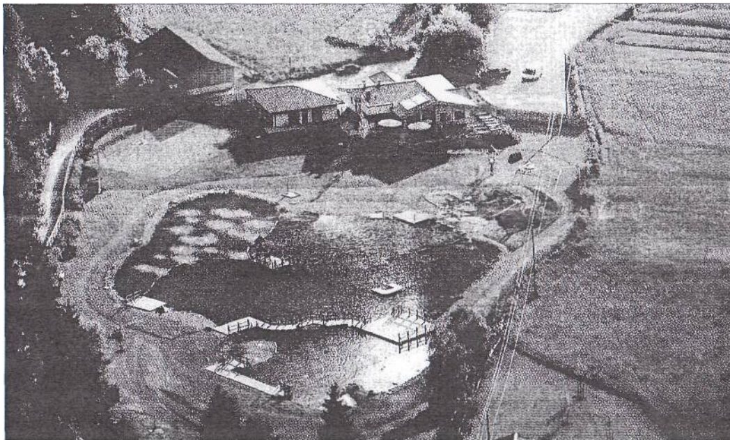
Mustergütig in die Landschaft integriert: der neue Badesee in Umhausen.

Der neue Badesee umfasst insgesamt eine Fläche von 11.500 Quadratmetern. Die Wasserfläche beträgt 3000 m 2 , davon der Schwimmbeckenbereich 2000 m 2 . Mit rund 22 Grad Celsius weist der Badesee bereits jetzt eine ideale