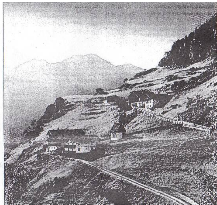
Wie ein Adlerhorst liegt der Weiler Farst hoch über Umhausen im Fels: ein beliebtes Ausflugsziel. Foto: TVB Umhausen

Der Stuibenfall, Tirols höchster Wasserfall, war schon immer eine Gästattraktion. Neuerdings wird dieses Naturschauspiel jeden Mittwoch ab 21 Uhr künstlich beleuchtet. Der